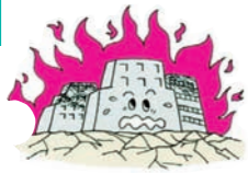
①地震で火災がおこり建物が焼けた