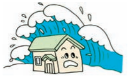
③津波により建物が流された

火災保険では、 ①地震等による火災(およびその延焼・拡大損害)によって生じた損害 ②火災(発生原因の如何を問いません)が地震等によって延焼・拡大したことにより生じた損害 はいずれも補償の対象となりません。 これらの損害を補償するためには、地震保険が必要です。